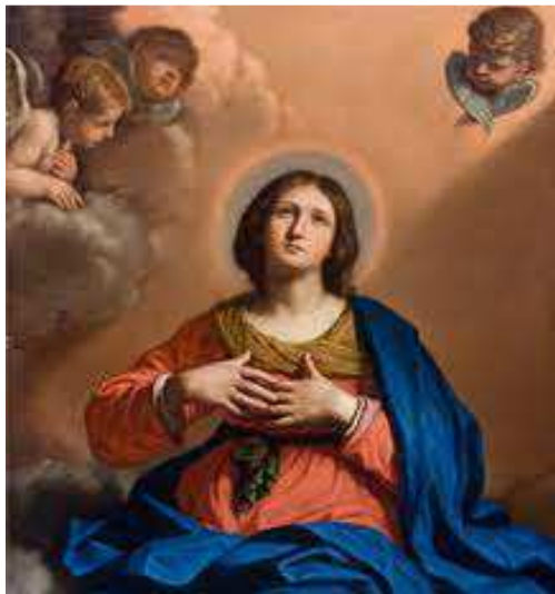
Cattedrale di Reggio Emilia. Assunzione del Guercino