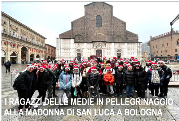
I RAGAZZI DELLA MEDIE IN PELLEGRINAGGIO ALLA MADONNA DI SAN LUCA A BOLOGNA

LA VITA DEI SEMINARISTI La vita del seminarista si sviluppa principalmente in tre ambiti: vita comunitaria, studio, servizio pastorale. 1) La vita comunitaria è scandita da un ritmo di preghiera (lodi e meditazione al mattino, vesperi e messa alla sera, preghiera personale e condivisione), da alcuni appuntamenti formativi e da impegni che appartengono alla quotidianità di ogni famiglia (pulizie, servizio a tavola, studio, momenti di svago, di amicizia e di fraternità, ...). La concretezza del vita feriale è un luogo prezioso di maturazione umana e spirituale. 2) Lo studio impegna i seminaristi per sei anni, gli esami da sostenere sono circa ottanta e il percorso termina con la discussione di un elaborato scritto (tesi) e la presentazione di un argomento a scelta ( lectio coram ). 3) Nel servizio pastorale i seminaristi condividono il ministero che un presbitero svolge in un'Unità Pastorale o in un Ufficio Diocesano. La finalità è l'educazione del cuore alla carità pastorale.