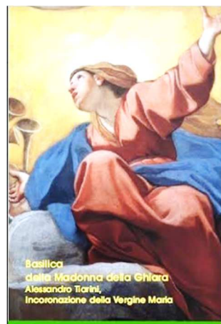
Basilica della Madonna della Ghiara Alessandro Tiarini, Incoronazione della Vergine Maria

«Signore Gesù, Parola eterna del Padre, per noi ti sei fatto silenzio. E nel silenzio che ci guida al tuo sepolcro c'è ancora una parola che vogliamo dirti ripensando al cammino della Via Crucis percorsa con te: grazie! Grazie, Signore Gesù, per la mitezza che confonde la prepotenza. Grazie, per il coraggio con cui hai abbracciato la croce. Grazie, per la pace che sgorga dalle tue ferite. Grazie, per averci donato come nostra Madre la tua santa Madre. Grazie, per l'amore mostrato davanti al tradimento. Grazie, per aver mutato le lacrime in sorriso. Grazie, per aver amato tutti senza escludere nessuno. Grazie, per la speranza che infondi nell'ora della prova. Grazie, per la misericordia che risana le miserie. Grazie, per esserti spogliato di tutto per arricchirci. Grazie, per aver mutato la croce in albero di vita. Grazie, per il perdono che hai offerto ai tuoi uccisori. Grazie, per avere sconfitto la morte. Grazie, Signore Gesù, per la luce che hai acceso nelle nostre notti e riconciliando ogni divisione ci ha reso tutti fratelli, figli dello stesso Padre che sta nei cieli».