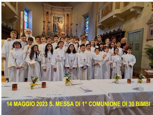
14 MAGGIO 2023 S. MESSA DI 1° COMUNIONE DI 30 BIMBI

ATTIVITA' SCOUT: SABATO 27 MAGGIO ore 15,30 – 18,30 Riunione Reparto