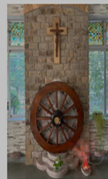
Cappella del noviziato Versova