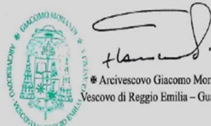
✱ Arcivescovo Giacomo Morandi Vescovo di Reggio Emilia - Guastalla

Vi accompagno con la mia preghiera e benedizione.